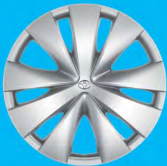
Fälgar, 14 tum stål med heltäckande hjulsidor Standard på x