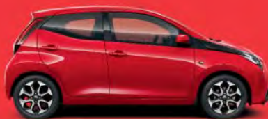
3P0 Super Red*