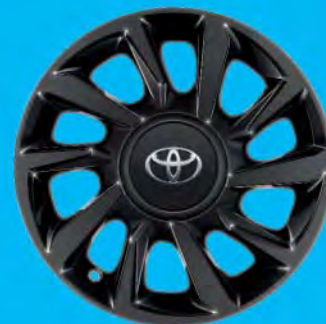
Fälgar, 15 tum lättmetall svarta blanka Standard på Selection