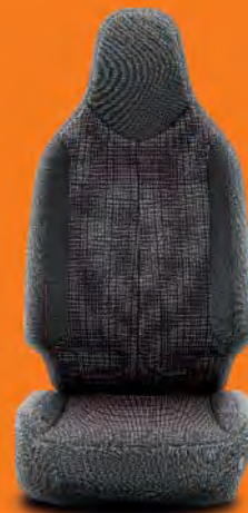
Svart tyg med s6m i magenta (FE20) Standard på Selection