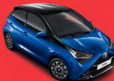
8Y5 Blue ME §°°