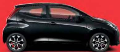
211 Black Mica §**