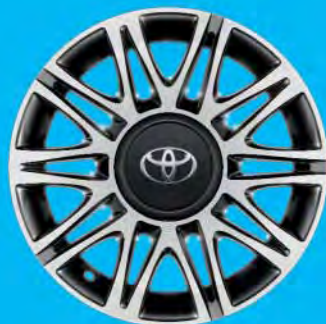
Fälgar, 15 tum lättmetall maskinbearbetade Standard på x-clusiv