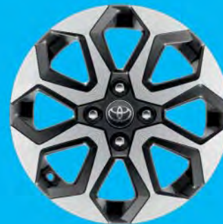
Fälgar, 15 tum lättmetall maskinbearbetade Tillval via paket till x-play