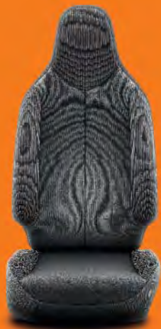
Svart/Grått tyg (FA20) Standard på x