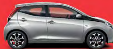
1E7 Silver Mica Metallic §°