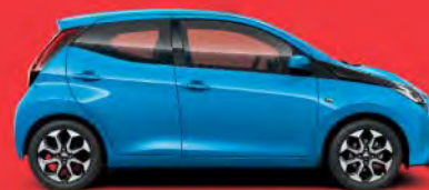
8W9 Cyan Metallic §**