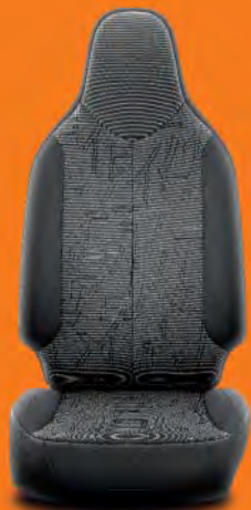
Mörkgrått halvsbinn (FD20) Standard på x-clusiv