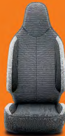
Mörkgrått tyg (FC20) Standard på x-play