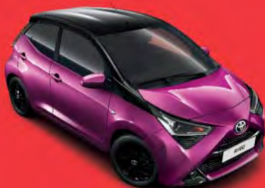
9AC Reddish Purple M.M §§