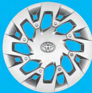
Fälgar, 15 tum stål med heltäckande hjulsidor Standard på x-play