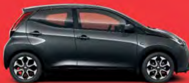
1E0 Dark Grey Mica* §